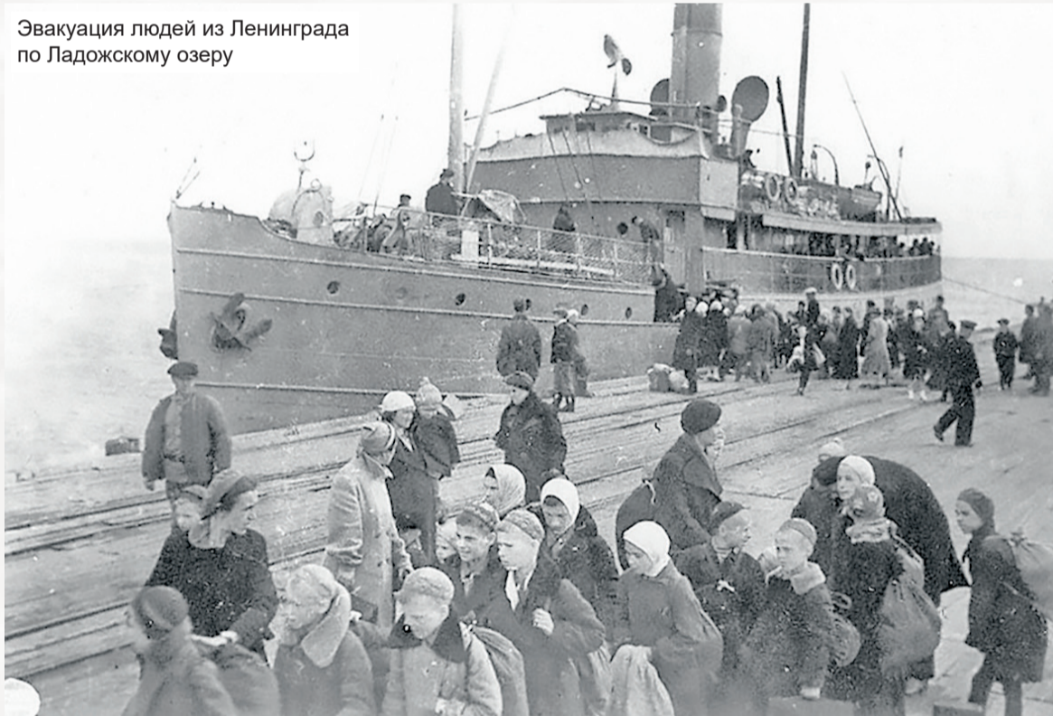
Эвакуация людей из Ленинграда по Ладожскому озеру

го подвижного состава: вагонов, цистерн и паровозов общим весом 34,4 тысячи тонн.