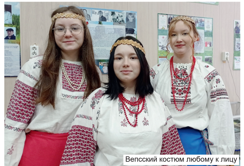
Вепский костюм любому к лицу

Программа конференции оказалась обширной и заняла более трёх часов. Прозвучали доклады, посвящённые изучению языка,