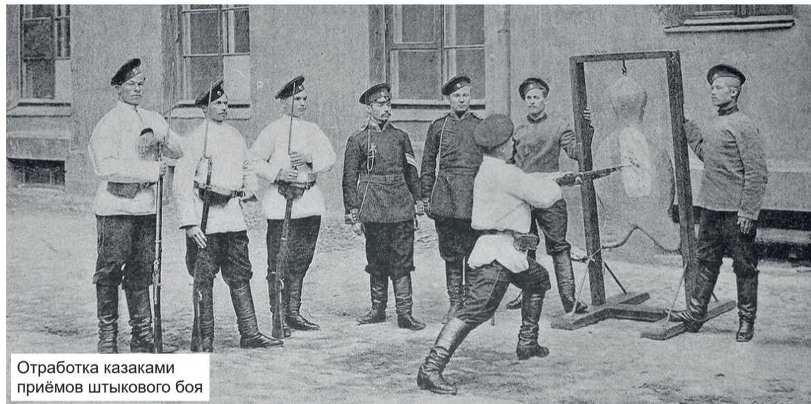
Отработка казаками приёмов штыкового боя

Там дед берёт крепкую жердь и обматывает её конец фуфайкой, даёт мне палку покорооче вместо винтовки и начинается войсковая наука. Первое, что в ней мне запомнилось, это как дед слегонца двинул меня по лицу этим балабухом. Дальше дело пошло веселее. Как я ни старался увернуться от этого балабуха, он всё равно попадал мне то под дых, то по рёбрам, то в живот, то в лоб. Дед хоть и старый был, но солдатскую науку помнил крепко. Погоняв меня с часок и натывав хорошенько, чуть ли не до слёз, балабухом, он объявил перерыв. Пока я чесал намятые бока, дед