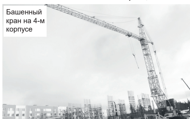
Башенный кран на 4-м корпусе