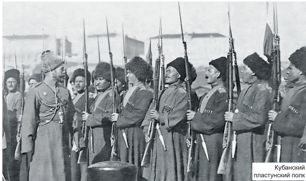
Кубанский пластунский полк

Дома нас ждёт жареный карп и вьюн, а ещё молодая жареная картошка. Всё это идёт под кисляк ( кислое молоко – прим. ред. ) и свежую паляницу ( большая буханка хлеба – прим. ред. ). Наевшись от пуза, прячемся от жары в хату. Надо отдохнуть. Окна закрыты ставнями и занавешены. Валимся на пол на разостланные ватные одеяла. Время есть и можно полтора-два часа прикорнуть. Минуты пролетают в одно мгновение. Бабка будит обоих, и мы снова направляемся на колхозный двор. По дороге узнаём, что греблю ( плотина, насыпь – прим. ред. ) в пруду снова загатили ( процесс завалки воды, топи или болота хворостом, соломой, землёй – прим. ред. ) и рыба больше не идёт по речушке. Значит, морда стоит напрасно.