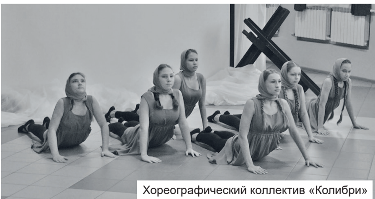
Хореографический коллектив «Колибри»

На встрече с прошлым никольчане вспомнили о своих родных