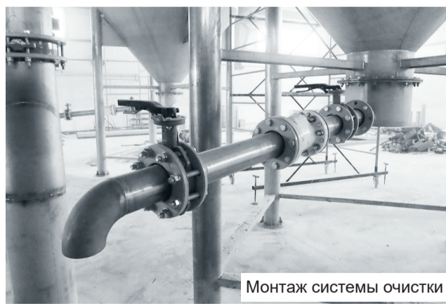
Монтаж системы очистки

я считаю расселение аварийного жилья для подпорожцев. Задачи стоят не менее амбициозные, чем раньше – за год построить новый красивый монолитный дом. Я уверен, что с этой задачей мы справимся, так как технология отработана. На стройке смонтирован башенный кран, работы идут по графику. В ноябре планируем завершить строительство и ввести объект в эксплуатацию. В начале