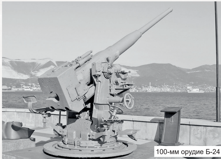
100-мм орудие Б-24