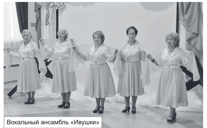
Вокальный ансамбль «Ивушки»